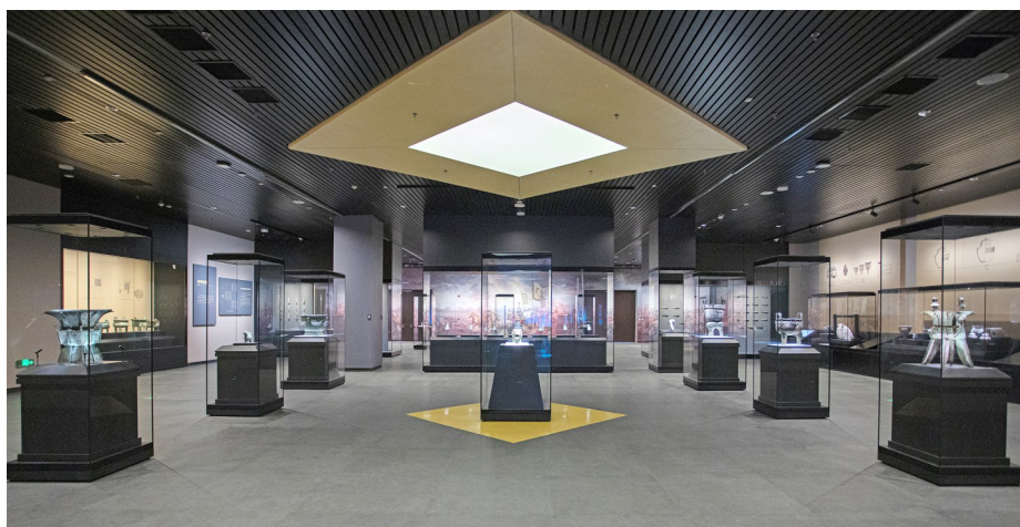
殷墟博物馆新馆展厅一角