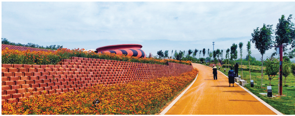
仰韶村国家考古遗址公园一角(由南向北)