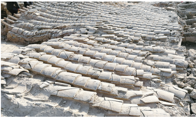
开封州桥汴河遗址上坍塌的明代房屋瓦顶(由南向北)

习近平总书记在2024年新年贺词中指出：“良渚、二里头的文明曙光，殷墟甲骨的文字传承，三星堆的文化瑰宝，国家版本馆的文脉赓续……泱泱中华，历史何其悠久，文明何其博大，这是我们的自信之基、力量之源。”在中华大地上，如果说浩如烟海的文献典籍记载和述说着源远流长、博大精深、星罗棋布的中华文明，那么，星罗棋布的文化遗产则彰显和实证着一脉相承、灿烂辉煌的中华文明。党的十八大以来，习近平总书记高度重视文化遗产保护和利用工作，在习近平新时代中国特色社会主义思想指引下，中国的文化遗产工作取得了举世瞩目的历史性成就。如何在新的起点上，坚持“保护第一、加强管理、挖掘价值、有效利用、让文物活起来”的工作要求，全面加强文化遗产保护传承，既是深入贯彻落实习近平文化思想的要求，也是践行“第二个结合”、更好担负起新的文化使命的要求。