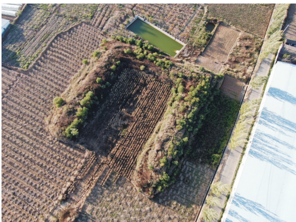
祥云县云南驿飞机窝子遗址

以云南抗战史为主线，以云南交通史为副线，主体部分为抗战时期的云南交通，分“回降千年：云南历史上的大通道”“大后方：抗战时期的云南”“大动脉：抗战时期中国经济社会的主通道与生命线”“大变革：云南社会生活的转变”“大发展：开创新面向南亚东南亚辐射中心新局面”五个单元。展览交通线给云南带来的深刻变化和发展机遇以及今天的云南建设面向南亚东南亚辐射中心迸发的活力。 策展团队注重实地调研，以实地观察、访谈、文字记录、影像拍摄等方式对滇越铁路、滇缅公路、驼峰航线的重要遗迹进行考察，并征集展品，强化了对革命文物资源的利用。经调查发现，不少遗迹的保存现状堪忧，团队所收集的资料客观真实地保存了日益消逝的历史信息，显得尤为珍贵。对征集到的文物，第一时间进行信息采集、检查病害、保养修复并登记入库，纳入藏品管理系统。通过前期研究制定展品征集计划和保护措施，通过实地调研充分复原展品在社会生活变迁中的信息，阐明展品与当下人群的关联，提升观众保护文化遗产的意识。