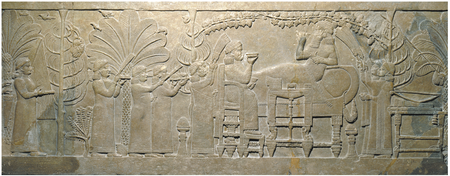
图6 花园宴饮浮雕 大英博物馆藏