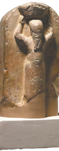
图2 沙马什·舒姆·乌金雕像 大英博物馆藏