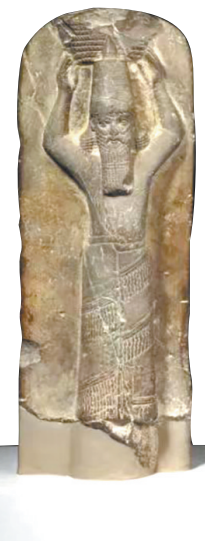
图1 亚述巴尼拔雕像 大英博物馆藏