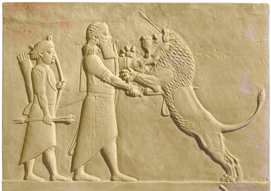
图3 猎狮雕像 大英博物馆藏

猎杀狮子这种来自蛮荒之地的野兽，来彰显自身击败混乱之力、维护世界秩序的形象。研究表明，这种形象可能被用作宣传国王的决心和决心，并宣称他对亚述人民的保护承诺。