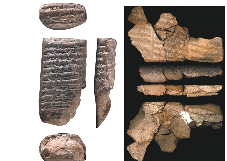
图7 尼尼微图书馆泥板文献