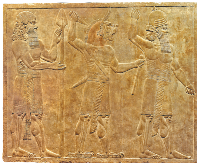
图4 守护精灵 大英博物馆藏

公元前669年，亚述巴尼拔继承父亲的王位，成为了亚述的国王。他所接手的是一个庞大的帝国，有许多富丽堂皇的王室核心区，包括古老的宗教之都古城阿舒尔(Ashur)和卡拉赫(Kalhu)(今尼姆鲁德)，其中最宏伟的要数由他的祖父辛那赫里布创建的尼尼微。19世纪40年代开始，随着尼尼微遗址考古工作的不断推进，系列城址、宫殿遗址和建筑构件等文物相继发掘出土，尼尼微的宏伟规模、壮美建筑的精致细节逐步得以重现。