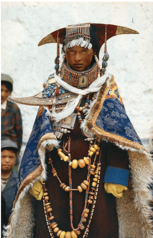
图四 西藏阿里普兰县鲜舞中的盛装姑娘（图片引自张鹰主编《西藏服饰》，上海人民出版社，2009年，第133页。）