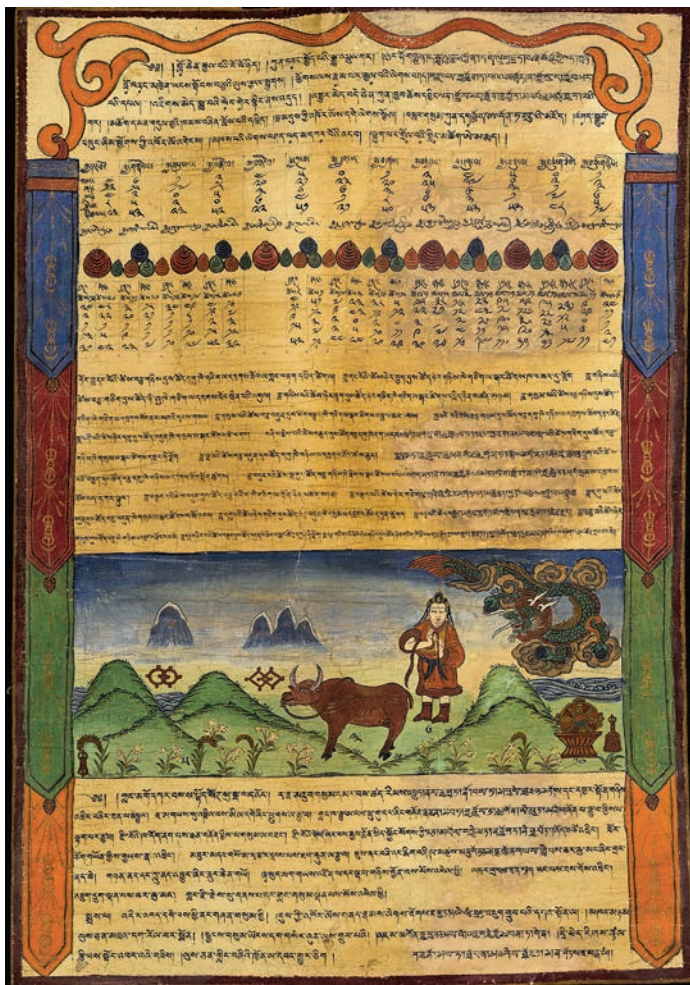
图五 清代藏东风格彩绘历算唐卡

峰、双目炯炯”，认为牦牛是雪域“四蹄物中最奇妙”“耐力超过四方众”，并希望“无情敌人举刀时，心中应存怜悯意”。足见八思巴这位高僧对牦牛的喜爱和赞叹。